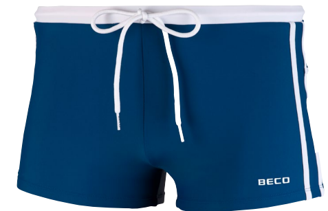
627 SQUARE LEG 4-10 REGULAR FIT 71 marine/weiß navy/white

Badeshorts in Board-Shorts-Optik | Flacher Bund mit Schnürung vorn | Elastischer Bund hinten | 100% Polyester Swim short in a board shorts look | Flat waistband with front tie fastening | Elastic band at the back | 100% polyester