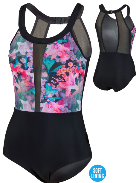
434 SWIMSUIT CLIP BACK MESH 36-44 B-CUP TIGHT FIT 990 schwarz/bunt black/multi coloured