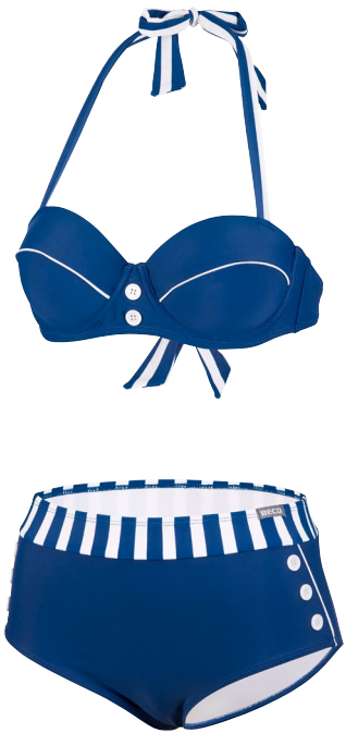
214 BIKINI SET CLASSIC HALTER NECK 36-46 B-CUP COMFORT FIT 71 marine/weiß navy/white