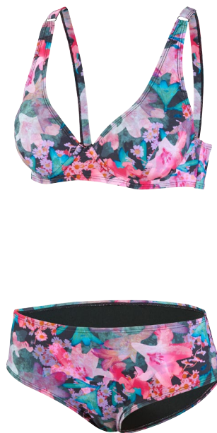
191 BIKINI SET CLASSIC 36-46 C-CUP COMFORT FIT 990 schwarz/bunt black/multi coloured

Badeanzug mit Nackenverschluss | Netz-Einsätze | Mittelhoher Beinausschnitt | 80% Polyamid, 20% Elastan Swimsuit with clip back | Mesh inserts | Medium leg cut | 80% Polyamid, 20% Elastan