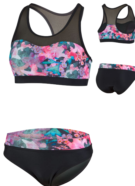
193 BIKINI SET RACERBACK MESH 36-44 B-CUP REGULAR FIT 990 schwarz/bunt black/multi coloured

Bügel-Bikini-Set mit sehr gutem Halt | Herzförmiges Dekolleté | Form-Cups | Mit Bikini-Hose CLASSIC MID-RISE | 80% Polyamid, 20% Elastan Wire bra bikini set with excellent hold | Heart-shaped décolleté | Shaping cups | With bikini pants CLASSIC MID-RISE | 80% polyamide, 20% elastane