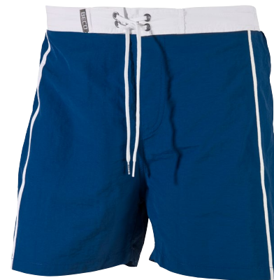
786 SWIM SHORT SURF S, M, L, XL, 2XL TIGHT FIT 71 marine/weiß navy/white COLLECTION 1927

Badeanzug mit kurzem Bein | 80% Polyamid, 20% Elastan Swimsuit with short legs | 80% polyamide, 20% elastane