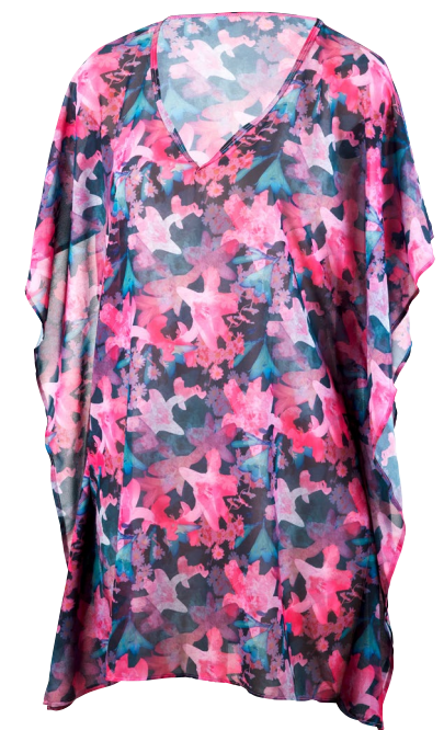
525 BEACH DRESS TUNIC ONE SIZE 990 schwarz/bunt black/multi coloured

Sport-Bikini | Crop Top | Ringerrücken mit Mesh-Einsätzen | Mit Bikinihose VARIO | 80% Polyamid, 20% Elastan | Mesh: 90% Polyester, 10% Elastan Sports bikini | Crop top | Racerback with mesh inserts | With bikini pants VARIO | 80% polyamide, 20% elastane | Mesh: 90% polyester, 10% elastane