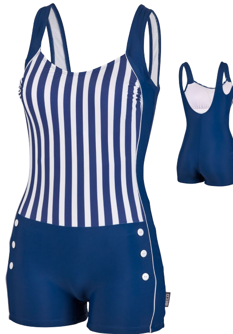
432 SWIMSUIT SHORT LEG 36-46 C-CUP COMFORT FIT 71 marine/weiß navy/white

Bügel-Bikini mit sehr gutem Halt | Herzförmiges Dekolleté | Form-Cups | Im Nacken und im Rücken zum Binden | Mit Bikini-Hose HI-WAIST | 80% Polyamid, 20% Elastan Wire bra bikini with excellent hold | Heart-shaped décolleté | Shaping cups | To tie at the neck and back | With bikini pants CLASSIC HI-WAIST | 80% polyamide, 20% elastane