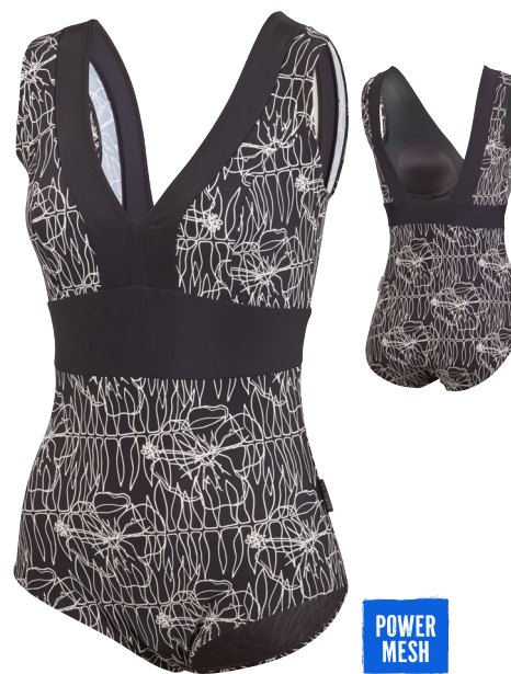
396 SWIMSUIT SIDE SMOOTH 38–48 C-CUP COMFORT FIT 10 schwarz/weiß black/white