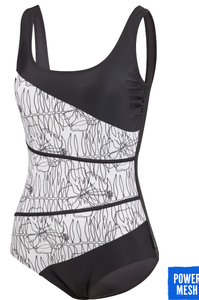
398 SWIMSUIT CLASSIC 38–54 C-CUP COMFORT FIT 10 weiß/schwarz white/black