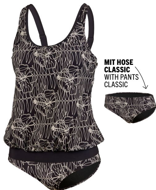
180 TANKINI SET BLOUSE 38–48 C-CUP COMFORT FIT 0 schwarz black