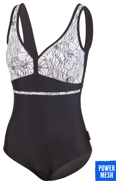
397 SWIMSUIT CLASSIC V-NECK 38–48 C-CUP COMFORT FIT 10 weiß/schwarz white/black