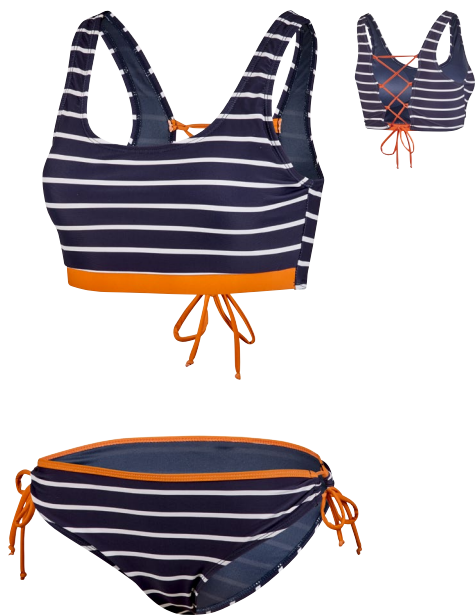
189 BIKINI SET CORSET 36 – 44 B-CUP REGULAR FIT 73 marine/orange navy/orange