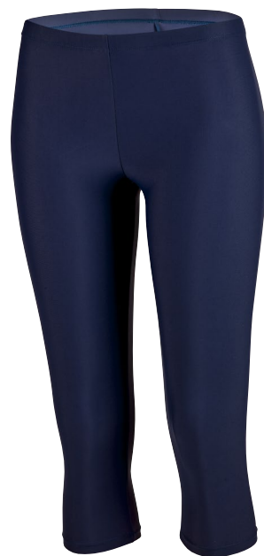
3653 SWIM LEGGINGS CAPRI S, M, L, XL, 2XL REGULAR FIT 73 marine navy