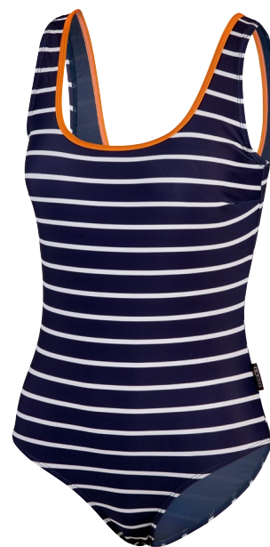
409 SWIMSUIT SCOOP NECK 36 – 44 B-CUP REGULAR FIT 73 marine/orange navy/orange