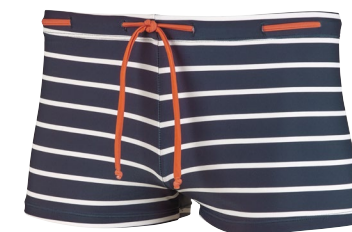
636 SQUARE LEG 4 – 10 REGULAR FIT 73 marine/orange navy/orange NEWPORT