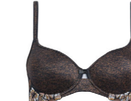
Schalen BH 3 554 02 A-B 75-105 E-F 70-95 C-D 70-100 G 70-90