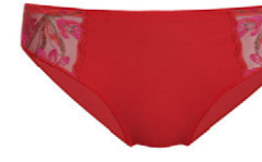
Slip 3 551 20 SIZE 38-50