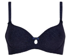
Schalen BH 3 550 02 A-B 75-105 G 70-90 C-D 70-100 H 70-85 E-F 70-95