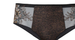
Panty 3 554 25 SIZE 36-46