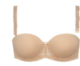
Schalen BH abnehm. Träger 3 535 04

A 80-110 E 70-90 B 75-105 F 70-85 C 70-100 G 70-80 D 70-95