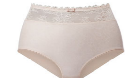
Taillenslip 3 509 21