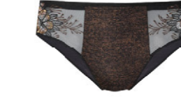
Slip 3 554 20 SIZE 38-50