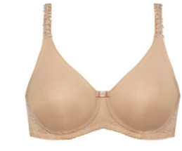
Molding BH ohne Bügel 3 535 17

A 80-110 E 70-90 B 75-105 F 70-85 C 70-100 G 70-80 D 70-95