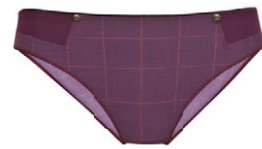
Slip 3 537 20 SIZE 36-50