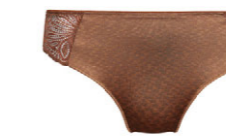
String 3 555 23 SIZE 36-46