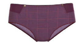
Panty 3 537 25 SIZE 36-46