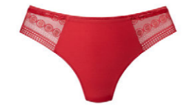
String 3 510 23