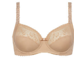
Bügel BH 3 535 18

A-B 75-110 F 65-95 C-D 70-105 G 65-90 E 65-100 H 65-85