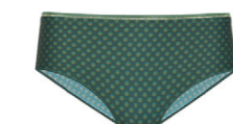
Panty 3 553 25 SIZE 36-46