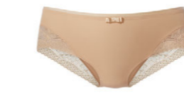
Panty 3 535 25