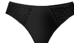
String 3 545 23 SIZE 36-46