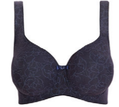
Molding BH 3 550 16 B-C 80-100 F 75-90 D-E 75-95 G 75-85