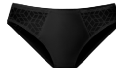
Slip 3 545 20 SIZE 38-52