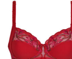
Bügel BH 3 551 18 B-C 75-100 F 70-90 D-E 70-95