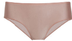
Panty 3 549 25 SIZE 36-48