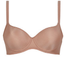
Schalen BH 3 549 02 A-C 70-100 G 65-90 D-F 65-95