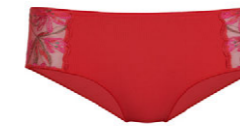
Panty 3 551 25 SIZE 36-48