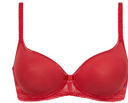
Schalen BH 3 510 02