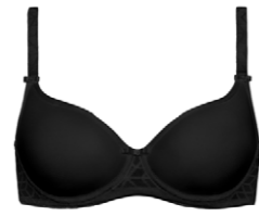
Schalen BH 3 545 02 A-B 75-110 F 65-95 C-D 70-105 G 65-90 E 65-100 H 65-85