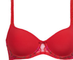
Schalen BH 3 551 02 A-B 75-105 E-F 70-95 C-D 70-100 G 70-90