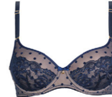
Schalen BH 3 552 02 A-B 75-100 D-F 70-95 C 70-100 G 70-90