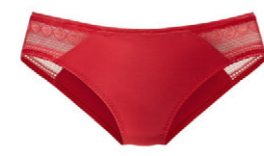
Slip 3 510 20