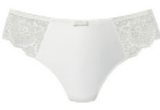
String 3 521 23