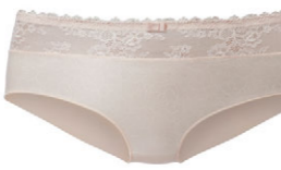
Panty 3 509 25