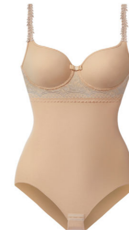
Schalen Body 3 535 37