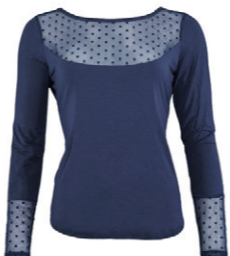
Langarmshirt 3 552 87 SIZE 36-46