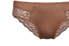
Slip 3 555 20 SIZE 38-50