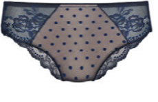
Slip 3 552 20 SIZE 38-50