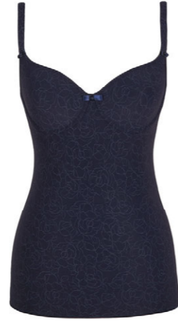
BH-Hemd 3 550 08 B 75-95 E-F 70-85 C-D 70-90