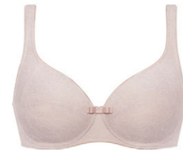
Bügel BH glatt 3 509 181

B 85-100 G 75-85 C 75-100 H 80-85 D-F 75-95