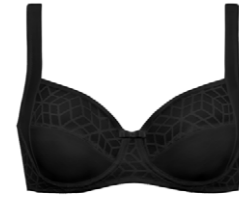
Bügel BH 3 545 18 B-C 75-100 G 70-90 D-F 70-95 H 70-85