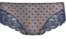
Panty 3 552 25 SIZE 36-48