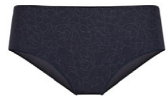
Panty 3 550 25 SIZE 36-48