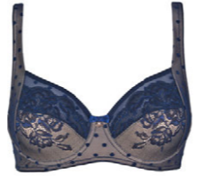
Bügel BH 3 552 18 B-C 75-105 F 70-95 D-E 70-100 G 70-90