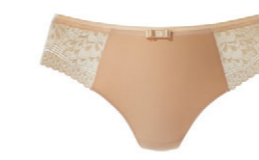
String 3 535 23