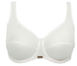
Bügel BH 3 226 18

B-C 80-110 G 70-95 D 75-110 H 70-90 E 70-105 F 70-100