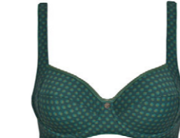
Bügel BH 3 553 18 B-C 75-100 F-G 75-90 D-E 70-95