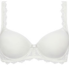
Schalen BH 3 521 02