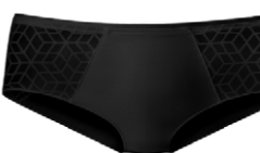
Panty 3 545 25 SIZE 36-48