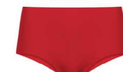
Taillenslip nahtlos 3 551 61 SIZE 36-48