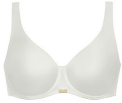
Molding BH 3 226 16

B-C 80-110 G 70-95 D 75-110 H 70-90 E 70-105 F 70-100