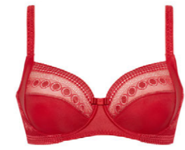
Bügel BH 3 510 18