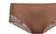
Panty 3 555 25 SIZE 36-46