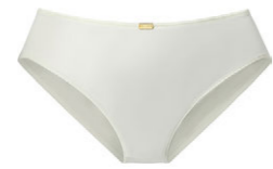
Slip 3 226 20