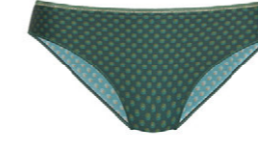
Slip 3 553 20 SIZE 38-50