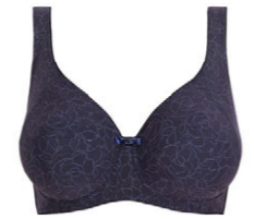
Bügel BH 3 550 18 B-C 85-110 F-G 80-100 D-E 80-105 H 80-95