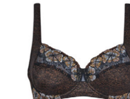
Bügel BH 3 554 18 B-C 75-100 F 70-90 D-E 70-95