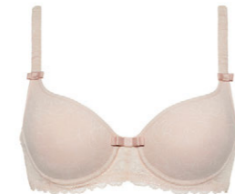
Schalen BH 3 509 02