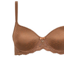
Schalen BH 3 555 02 A-C 75-100 G 70-90 D-F 70-95 H 70-85