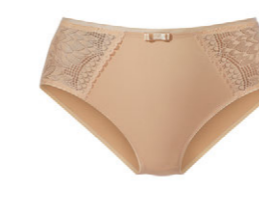
Taillenslip 3 535 21