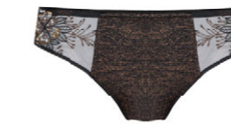
String 3 554 23 SIZE 36-46