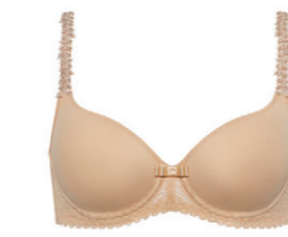
Schalen BH 3 535 02

A-B 75-110 F 65-95 C-D 70-105 G 65-90 E 65-100 H 65-85