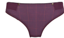
String 3 537 23 SIZE 36-46