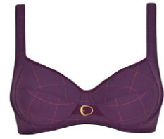
Bügel BH 3 537 18 B-C 80-105 E 75-95 D 75-100 F 75-90