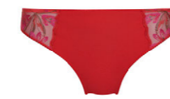
String 3 551 23 SIZE 36-46