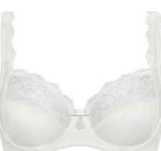
Bügel BH 3 521 18

A 80-110 D 70-95 B 75-105 E 70-90 C 75-100