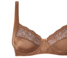
Bügel BH 3 555 18 B-C 75-100 F 75-90 D-E 70-95