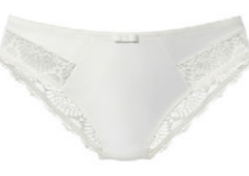
Slip 3 521 20