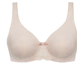
Molding BH 3 509 16

B 85-100 G 75-85 C 75-100 H 80-85 D-F 75-95