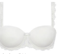
Schalen BH variable Träger 3 521 04

A 80-110 D 70-95 B 75-105 E 70-90 C 75-100