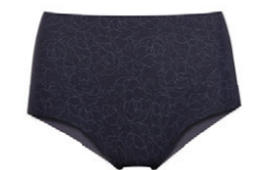
Taillenslip nahtlos 3 550 61 SIZE 36-48