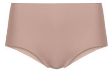
Taillenslip nahtlos 3 549 61 SIZE 36-48