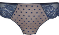
String 3 552 23 SIZE 36-46