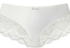
Panty 3 521 25