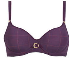
Schalen BH 3 537 02 A-C 70-105 F 65-95 D-E 65-100 G 65-90