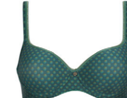
Schalen BH 3 553 02 A-B 75-110 F 65-95 C-D 70-105 G 65-90 E 65-100 H 65-85