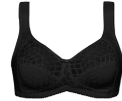
BH ohne Bügel 3 545 11 B-C 75-105 E 75-95 D 75-100 F 75-90