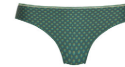
String 3 553 23 SIZE 36-46