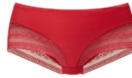
Panty 3 510 25