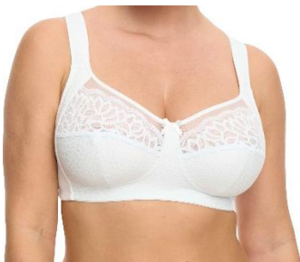
8238 BH ohne Bügel