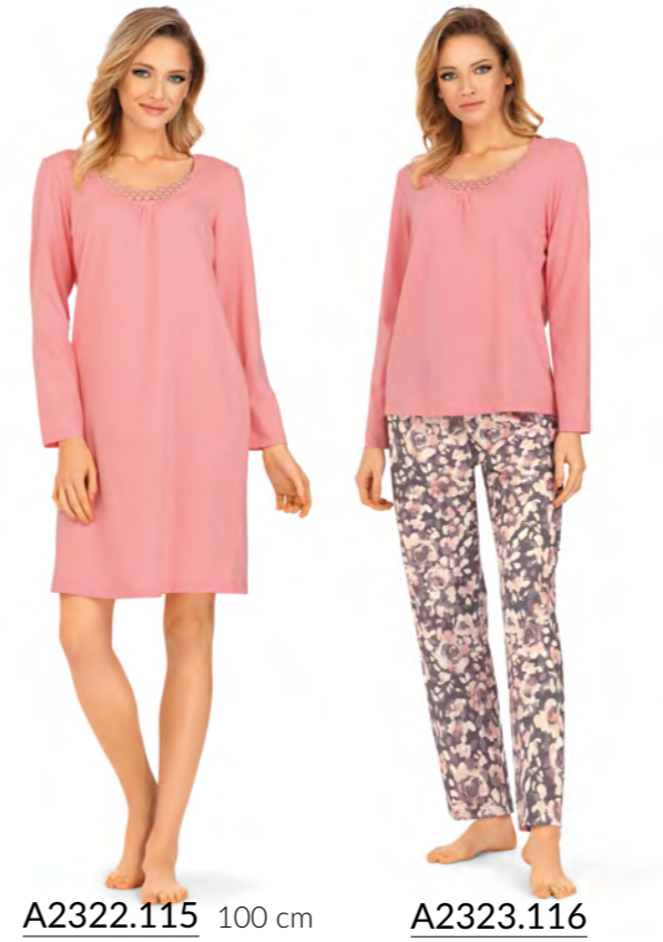
A2322.115 100 cm