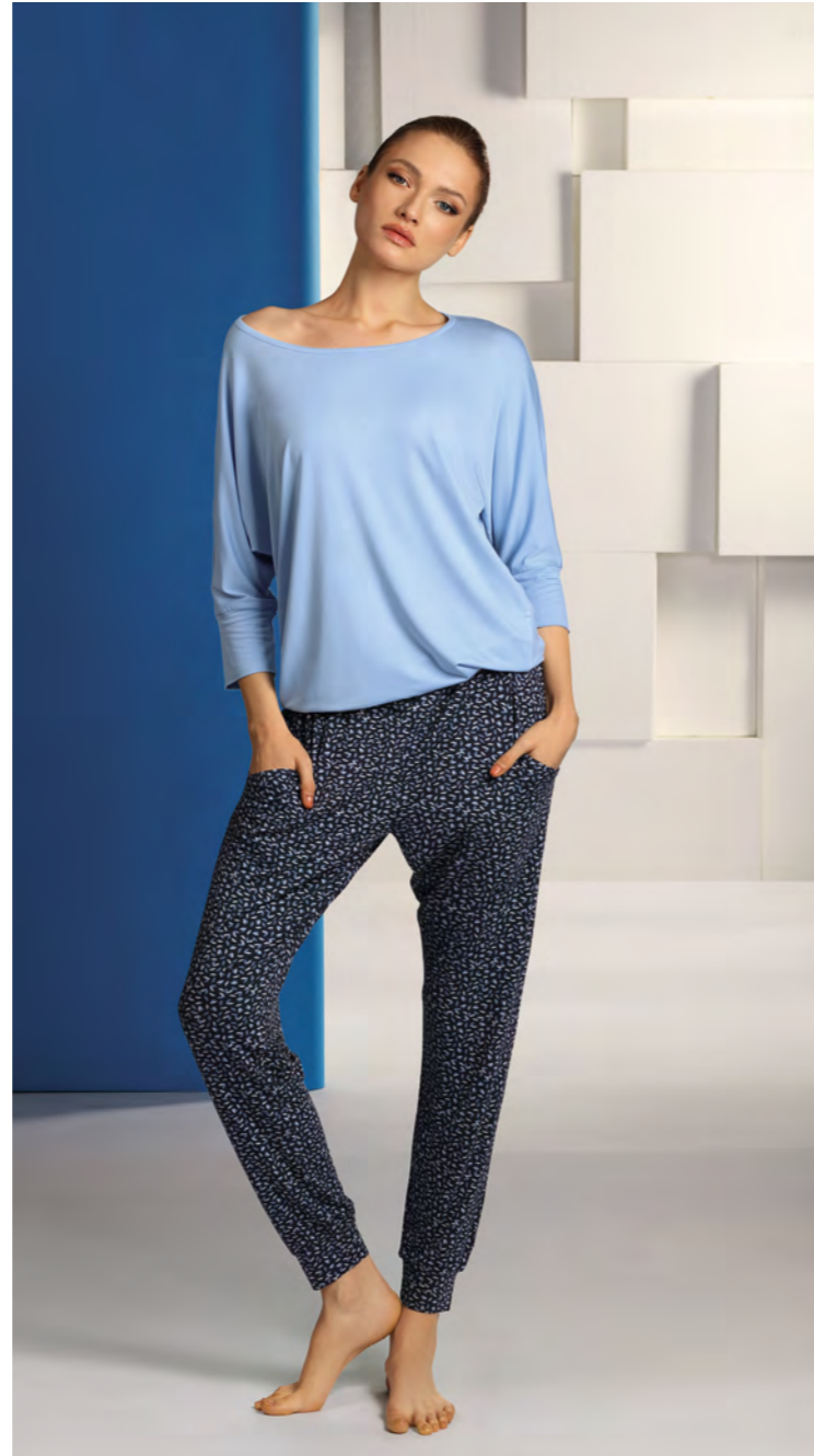
Single Jersey, 95% Viskose, 5% Elasthan | 38-52 ● sky/17 ● smoky/97