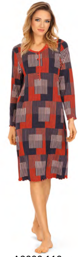
A2322.113 105 cm

Single Jersey, 96% Viskose, 4% Elastan | 38-52 ● navy/16