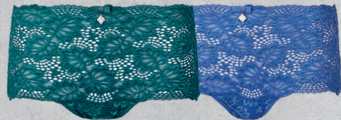
Panty // panty 6141 130 0 0