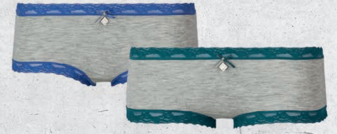
Panty // panty 6016 137 0 0