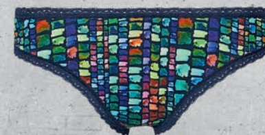
Lambada // lambada 6152 95 0 0