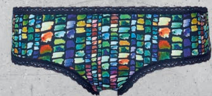
Hipster // hipster 6152 133 0 0