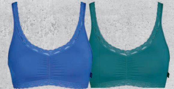
Soft-BH // soft bra 6006 520 0 0