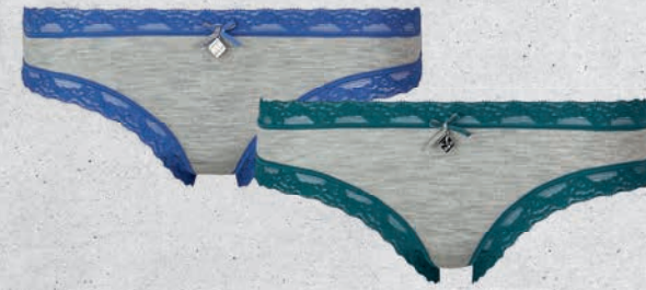
Minislip // low-rise brief 6016 50 0 0