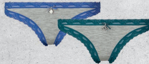
String // thong 6016 102 0 0