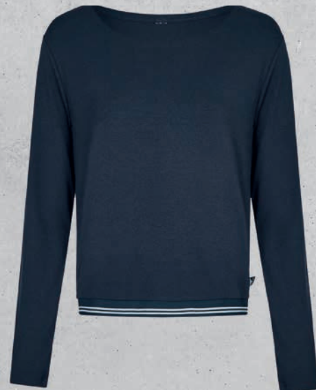
kürzeres Langarm-Shirt // cropped long sleeve shirt 6153 472 0 0