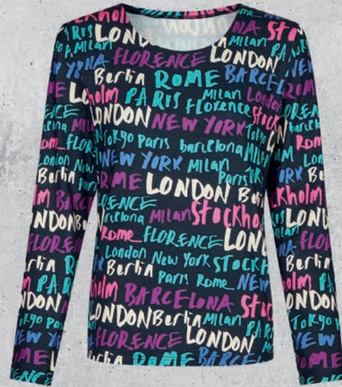
Langarm-Shirt // long sleeve shirt 6153 473 0 0