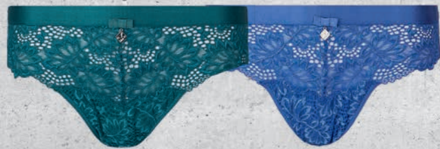
Jazzpant // jazz pant 6141 20 0 0