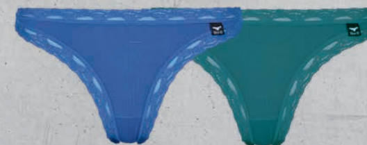
String // thong 6006 102 0 0