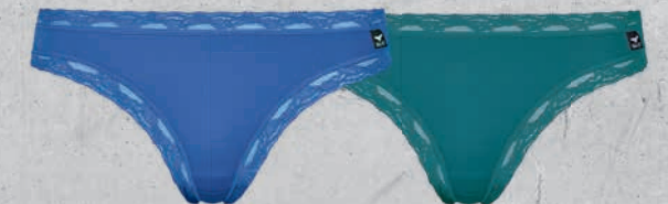
Minislip // low-rise brief 6006 50 0 0