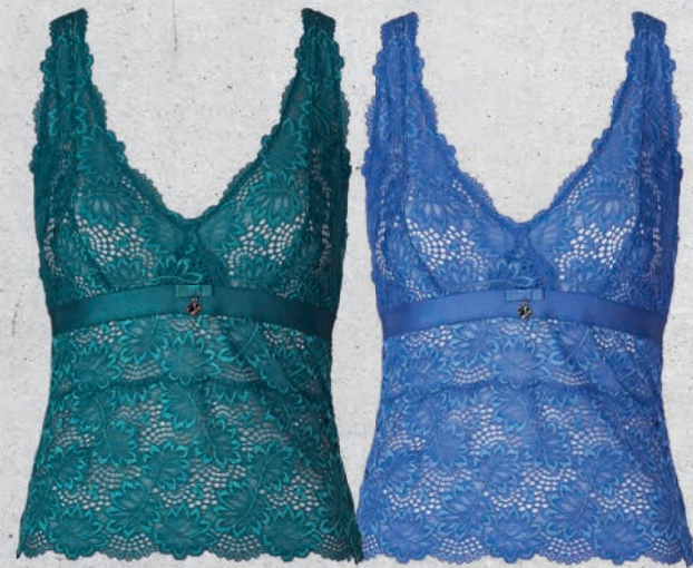
Top // top 6141 410 0 0