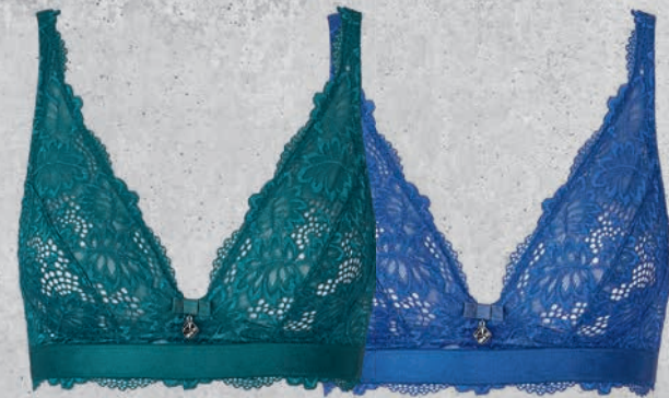
Bralette // bralette 6141 500 0 0