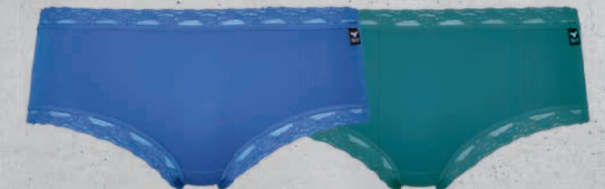
Panty // panty 6006 137 0 0

92% Polyamid, 8% Elastan // 92% polyamide, 8% elasthan Größe S/M/L/XL, Soft-BH S/M/L // sizes S/M/L/XL, soft bra S/M/L cornflower 376, deep lagune 458 Mindestmenge Tops: 3 Stk, Slips: 12 Stk // minimum tops: 3 pieces, briefs: 12 pieces