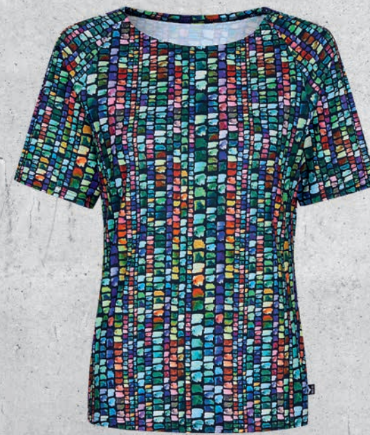
T-Shirt // t-shirt 6152 460 0 0

Unsere neue Wäscheserie aus Lenzing ECOVERO™ ist so angenehm zu tragen!