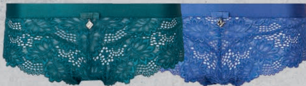
Lambada // lambada 6141 95 0 0